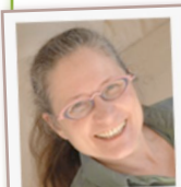
Validé par Isabelle FILLIOZAT

Un enfant qui pleurniche par exemple parce que l'eau est trop chaude, puis trop froide, puis que la serviette ne couvre pas ses orteils... n'éprouve pas de la tristesse ! Il est dans une réaction parasite camouflant une autre émotion. Par exemple, de l'anxiété par rapport à l'école ! En oui, les réactions émotionnelles parasites n'ont souvent rien à voir avec le problème sous-jacent . C'est pour cela qu'elles sont incompréhensibles pour le parent et qu'il les classe un peu rapidement dans la catégorie « caprice ». Les caprices, c'est tout ce que l'adulte ne comprend pas.